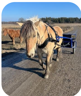
PS: Kan ni se Segull i hagen bakom Silas?

Så som dagarna rullar på så rullar även hjulen på vagnen på när Silas kör. Det går fortsatt bra med inkörningen. Vi har börjat köra lite utanför ridbanan för att bland annat kunna träna upp kör-muskulerna på Silas. Då använder vi oss lite utav distans men främst tränar vi i olika upp- och nedförsbackar, något som Silas tycker kan vara väldigt jobbigt då han får ta i riktigt ordentligt.